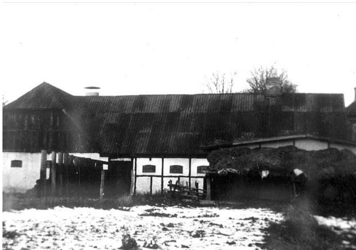
Suhrsminde, forlængst overbygget af roskilde-villaer.

Ikke alle gårdene kan omtales her – ejere af ejendomme helt ned til 12 tdr. land kaldte sig omkring 1945 ”gårdejere”, mens et par ”parcellister” nøjedes med 9-10 tdr. land. Helt inde ved sognegrænsen mod Roskilde lå Suhrsminde med 24 tdr. land plus en forpagtning på 10 tdr. land af Roskilde byjord.