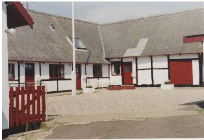
”Den gamle Gård”, Tingvej 28, 1991, nordvesthjørnet.