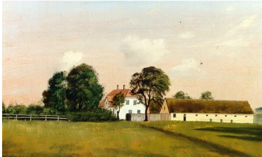
Maleri fra 1930 af Nygård set nord. Stuehuset er fra 1911

Erindringerne på Nygård suppleres af en selvstændig fortælling om Nygårds udvikling fra fæstegård i Vindinge, til den o. 1825 blev flyttet fra Vindinges bymidte ud på den nøgne jord næsten helt ude mod Øde Hastrup.