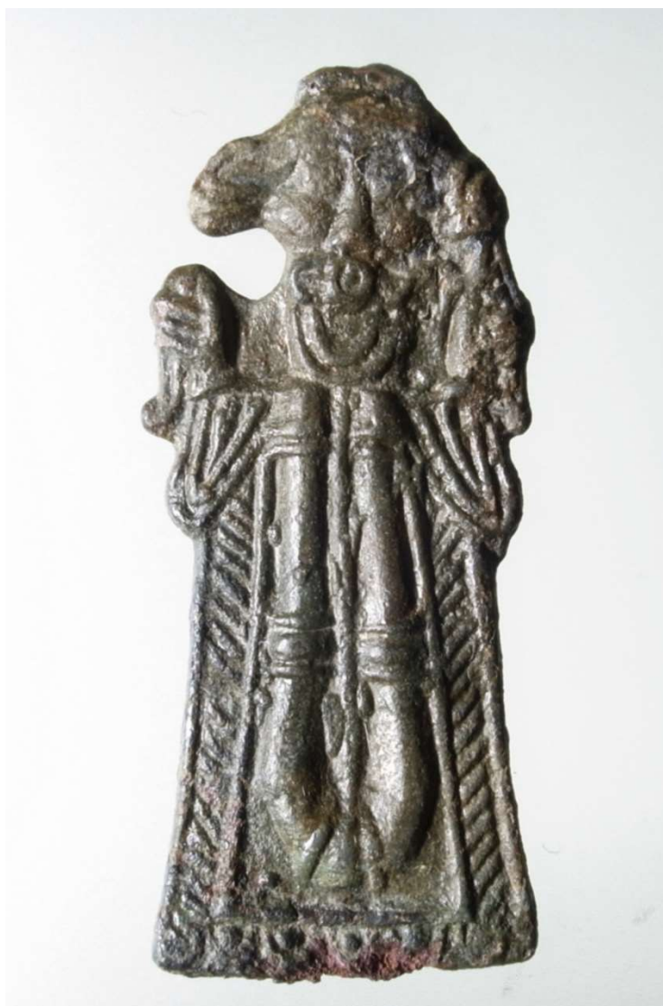
”Hårriveren fra Vindinge” fra 900-tallet (sen vikingetid). Har været båret som smykke.

”En ganske lille metalplade i kobberlegering, 4,1 cm i højden og 1,8 cm i bredden og blot 2 mm tyk”. Forsiden viser en menneskelignende figur, set forfra, med langt hår og lang klædedragt. Kastholm analyserer hårrivermotivet og når frem til to mulige figurfremstillinger: Den lidt løsagtige frugtbarhedsgudinde Freja eller en shaman eller åndemaner – der var shamanistiske elementer i den førkristne religion. Kastholm hælder til den sidste mulighed.